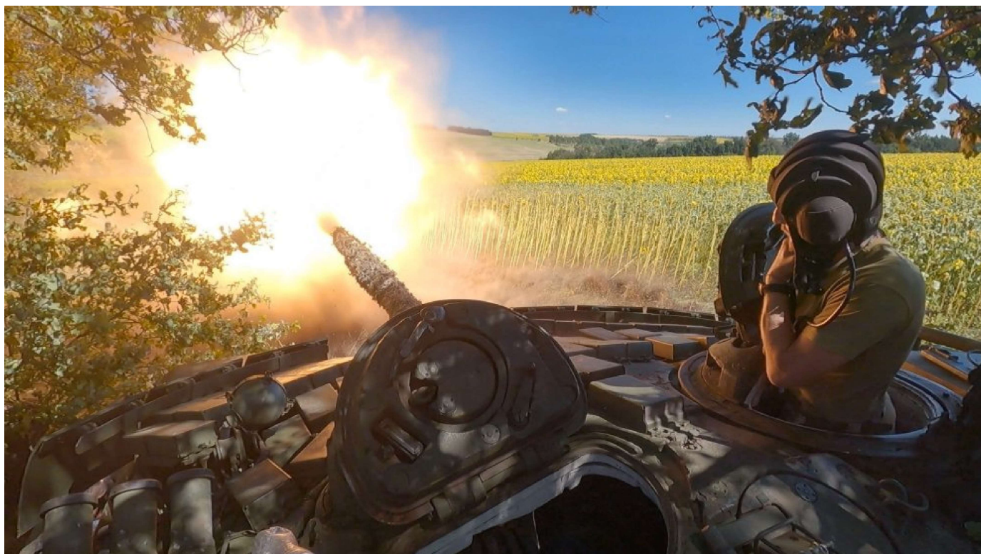
Ukrajinský tank počas strelby.

Ukrajinská politická reprezentácia scenár svojho víťazstva predostiera ako jediný možný, čo je logické. Žiadna vláda napadnutej krajiny nemôže definovať menší cieľ než oslobodenie celého územia a všetkých obyvateľov, zvlášť ak má dôveru, že na konci bojov bude na víťaznej strane.