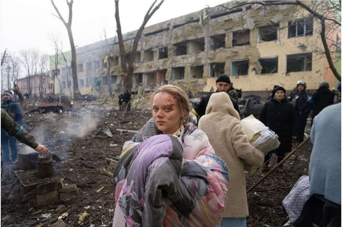
Bombardovanie pôrodnice v Mariupole.

Vzmáhalo sa po sovietskej priemyselnej ére, keď nieslo meno tamojšieho rodáka Andreja Ždanova, jedného z najbližších Stalinových podriadených, podpísaného pod mnohými rozsudkami smrti počas známeho obdobia „veľkého teroru“ .