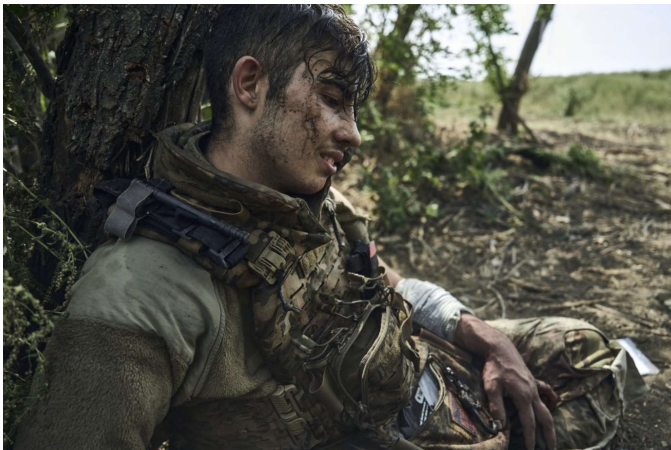
Zranený vojak počas bojov o Bachmut.

Späť k Ukrajine: dajme tomu, že sa rozdrobí americká pomoc, voľby za oceánom ovládne Donald Trump a že európska pomoc zoslabne a zostávajúce pomáhajúce štáty bremeno vojny neutiahnu. Z faktorov, ktoré by mohli byť problematické pre Rusko, nenastane nič podstatné.