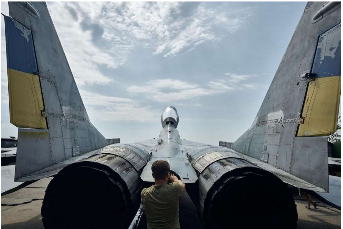
Exslovenský MiG-29 v ukrajinských službách.

Za akých okolností by scenár konfliktu nižšej intenzity nastal?