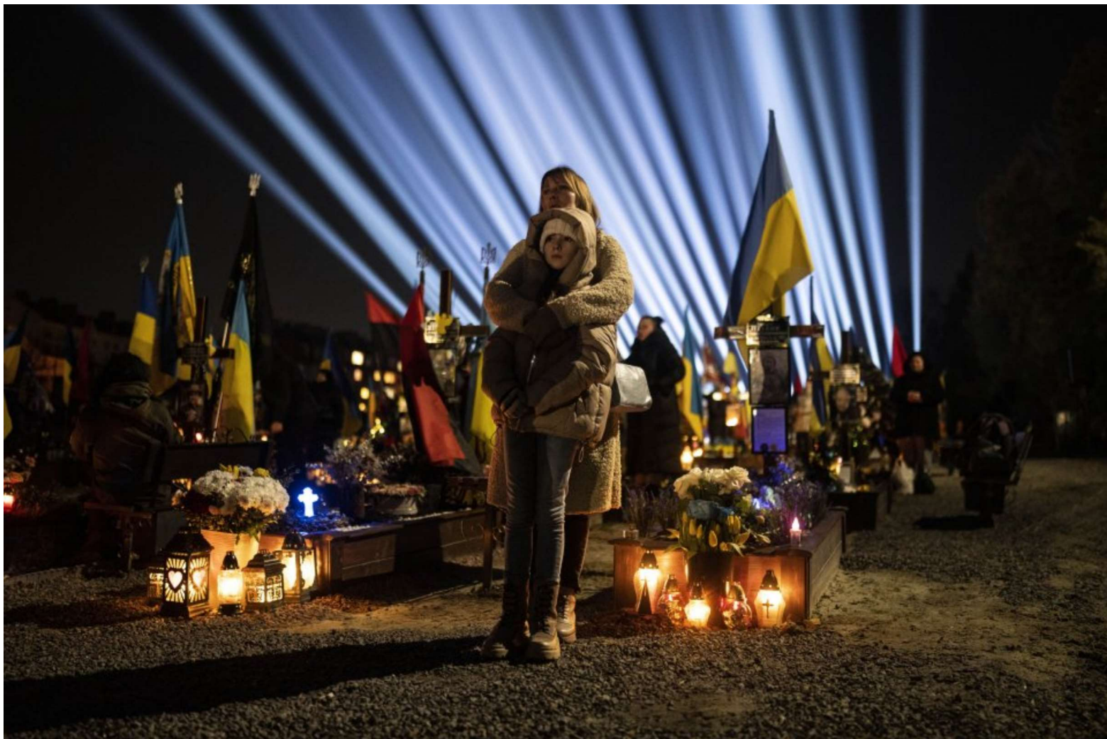
Ukrajinská žena a jej dcéra počúvajú modlitby za padlých vojakov.

Druhý rok ruskej agresie proti Ukrajine, ktorá je najväčšou vojnou v Európe od roku 1945, sa pomaly končí. Predtým veľmi dynamický konflikt sa po jeseni 2022 zmenil na pozíčnú vojnu, ukrajinská ofenzíva sa nedostala ku Krymu a vo svete sa čoraz viac píše o tom, že dianie bude nevyhnutne smerovať k dohode. Približujeme, aké scenáre sú teraz na stole.