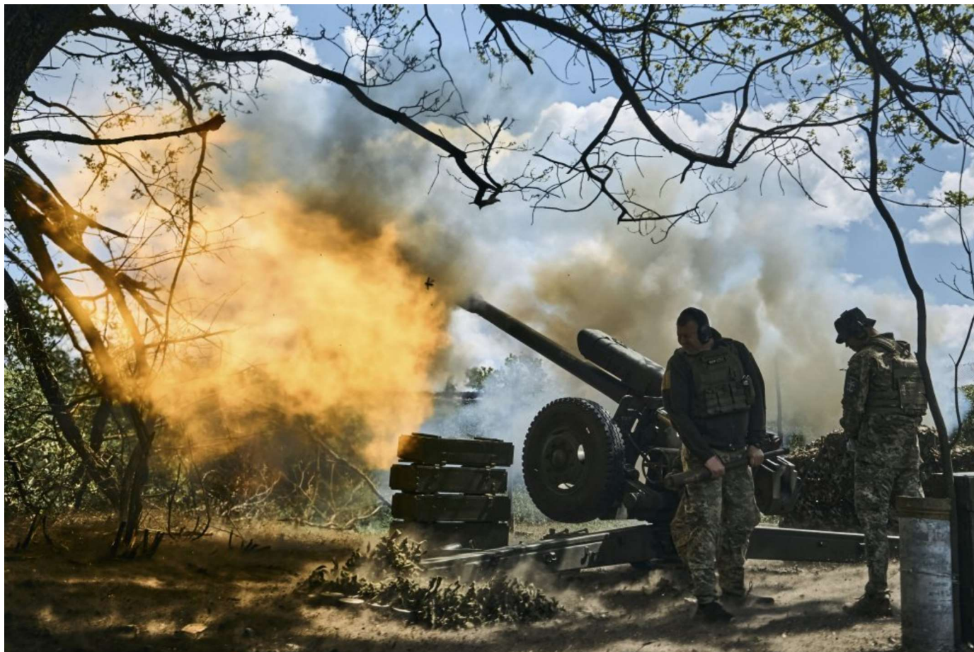
Ukrajinskí vojaci strieľajú z dela neďaleko mesta Bachmut v Doneckej oblasti na východe Ukrajiny.

Ukrajinský vojak Taras to pre The Times opísal jasne : keď máte jeden konkrétny typ delostreleckých granátov daného kalibru, úplne rovnakých, strieľate presnejšie. Keď ich máte mix, prestrelíte pokojne o 200 metrov.